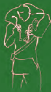
Figure 1. A person in a state of distress.

the person's face, and the person's hands are raised to their face.